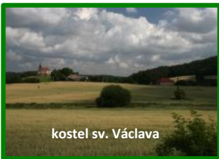
kostel sv. Václava

Obě trasy pak vedou na křižovatku v osadě Příbyšice - tu přejedete rovně směrem na Neštětice. Brzy narazíte na odbočku žluté turistické značky vedoucí na vrchol Neštětické hory, na kterém je postavena 16 metrů vysoká betonová rozhledna. Pro cyklisty není vhodné držet se žlutého turistického značení, lepší je jet po šotolinové a kamenité cestě, která nás po překonání 130 výškových metrů dovede k vrcholu. Rozhledna byla vybudována v roce 1927 na počest krutě potlačeného selského povstání z roku 1627. Neštětická hora je taktéž opředena řadou legend. V lesích v okolí se prý v dávných dobách nacházela studánka, která se třpytila zlatem a na jejím břehu rostla vrba se zlatými větvemi. Kolem se potulovaly slepice z obce Chvojínek, v jejichž žaludcích pak obyvatelé nacházeli zlato. Další legenda praví o hlavě zlatého koně, kterou zlatokopové jednoho dne odkryli na Neštětické hoře. Jeden z horníků však zaklel a hlava se propadla dvakrát tak hluboko. V současné době je však rozhledna v neudržovaném stavu a zarostlá lesním porostem. Rozhled je tak omezen pouze jihozápadním výsekem. Za hezkého počasí je možné na horizontu spatřit rozhlednu Drahoušek u Osečen.